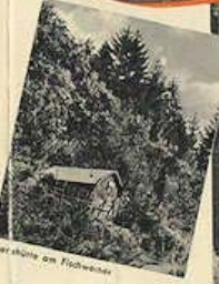
Karsthöhle am Flöhenberg