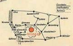
Fischweiler bei Hilgert

Bahnstation in Höhe-Grenzhausen (Bahnhof Grenzau) an der Strecke Engers (Rhein) - Siersahn (Westerwald). Zufahrtsstraßen von Köln und Wiesbaden - Rechte Rheinuferstraße bis Vallendar, von dort über Höhe-Grenzhausen nach Hilgert (7 km). Zufahrtsstraße von Frankfurt (M.) Limburg - Montabaur - Würges - Karsbach - Hilgert. Straßenbahn von Koblenz über Vallendar nach Höhe-Grenzhausen (Apothek), Autotaxen in Höhe-Grenzhausen, Fernruf 219.