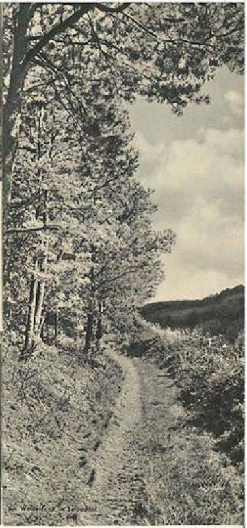
Waldsee am Eifelblick